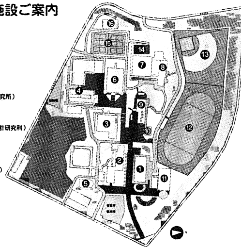
兵庫県立大学神戸商科キャンパス